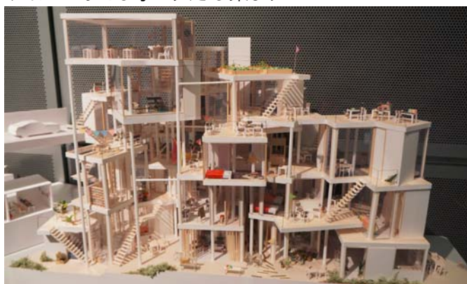
最優秀賞作品の模型