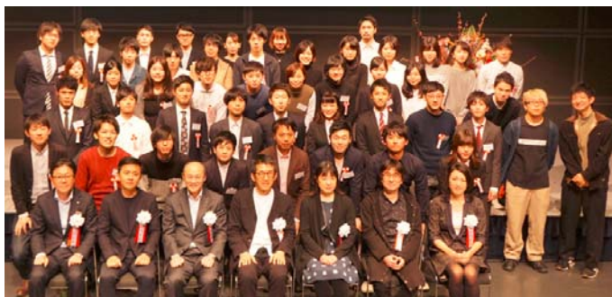
審査委員および受賞者の集合写真