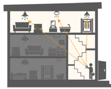
おでかけスイッチ(2階/3階)

1階の玄関から、2階や3階の照明を操作することができるため、照明の消し忘れがあっても、室内照明を一括操作できます。