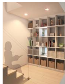
3階イメージ (階段踊り場)