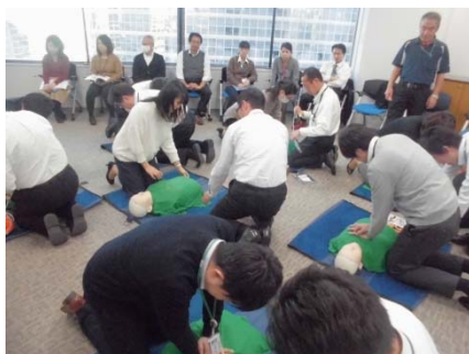
救命救急講習会の様子(2018年1月26日)

また、応急手当普及員資格を持つ大東建託パートナーズの社員が主導する形で、AEDの講習会を入居企業様の要望に応じて適時実施しています。この救急講習会を継続して実施し、いざという時により多くの方がAEDを操作できる体制を整えています。