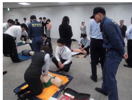
AEDの操作を学ぶ様子