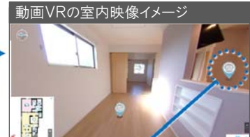
動画VRの室内映像イメージ

入居希望者は店舗でVR端末を覗き、実際の内見と同じようにスタッフの説明を聞きながら室内を確認。