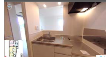
動画に埋め込まれた静止画VRで キッチンの内側や眺望など確認