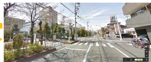
周辺環境