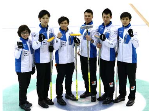
2018平昌五輪出場を決めた カーリング日本代表「SC軽井沢クラブ」