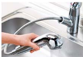
シングルレバーシャワー水栓