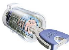
メモリーキー(玄関ドア)