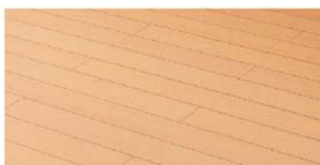
フローリング/防振フローリング(2階)