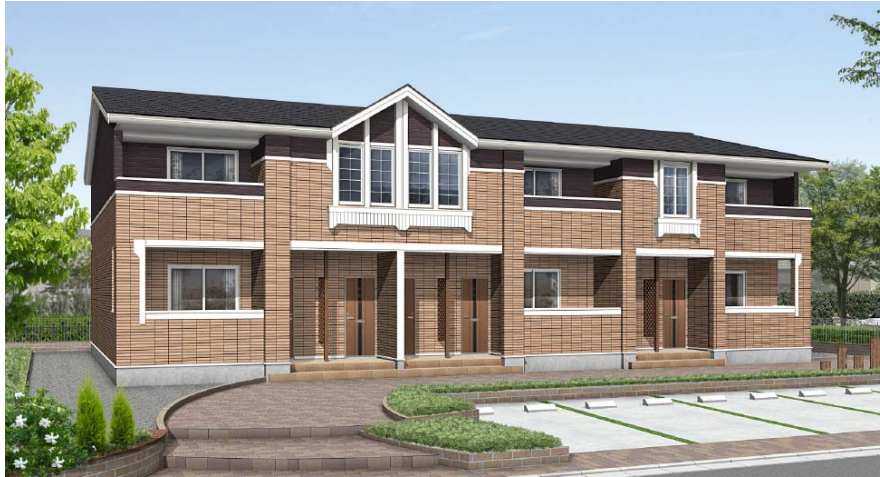
『コッティ・グレース』

このたび、シリーズ第3弾として『コッティ・グレース（Cotti “Grace”）』を販売開始しましたので、以下の通りお知らせします。（一部地域を除く）