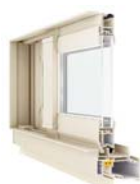
アルミサッシ (Low-E膜装ガラス)