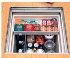
床下収納庫(1階住戸のみ)